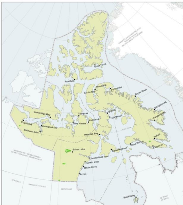
Figure 1: Nalunairutaa 1 Nunguyuittumut Qauyihainigut Nunavunmi 2010 mi

Nunavut amigaittunik nunguyuittumut piqarniqhutik, amihut ittuuvlutik Kivalliq aviktuumaninga (Nalunaitkuta 1). Tadjja, avatquumayut 30 nik inikhaliangit Nunavunmi talvangaanit kampaniit qauyihavilutik nunguyuittumut hauyunut angiyaaqtumik nanigumik uyaraqhiurtauyumaniit pivalliyumavlutik.